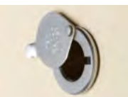
MIRILLA CLÁSICA Cromada o latón