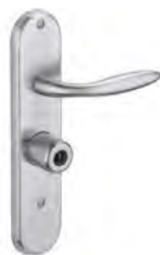
MANILLA Acabado cromado o latón pulido